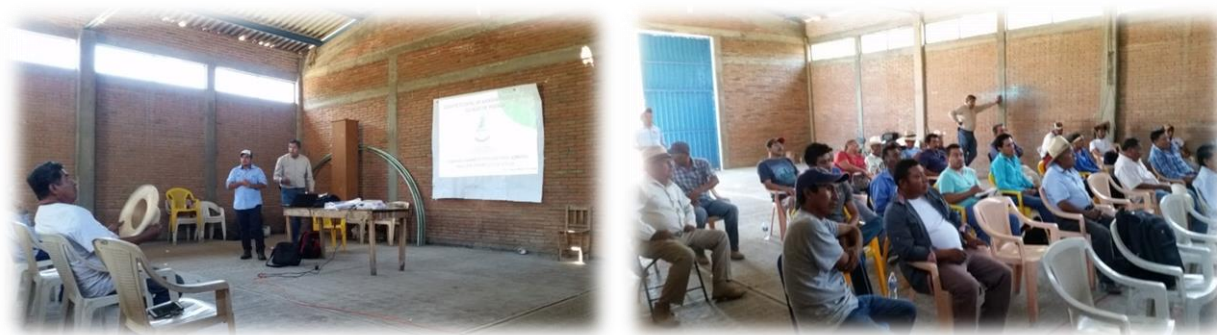
Figura 3. Entrenamiento a productores