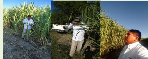
Exploracion en el cultivo de maíz y caña de azúcar