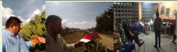
Revisión de trampa y fortalecimiento a productores