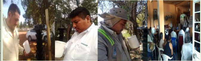
Revisión de Ruta de Trampeo y Fortalecimiento a productores