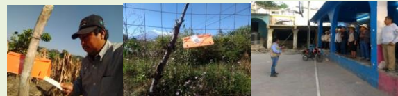
Revisión de Trampa y Fortalecimiento a productores