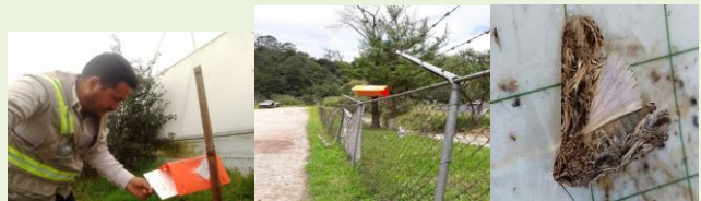
Revisión de trampas y espécimen sospechoso enviado al CNRF.