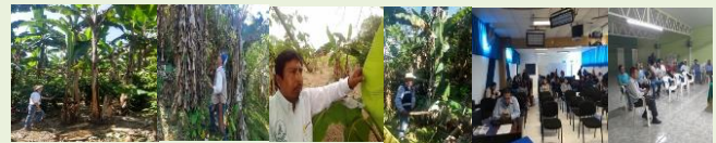
Exploración en puntos de vigilancia, parcela centinela y fortalecimiento a productores